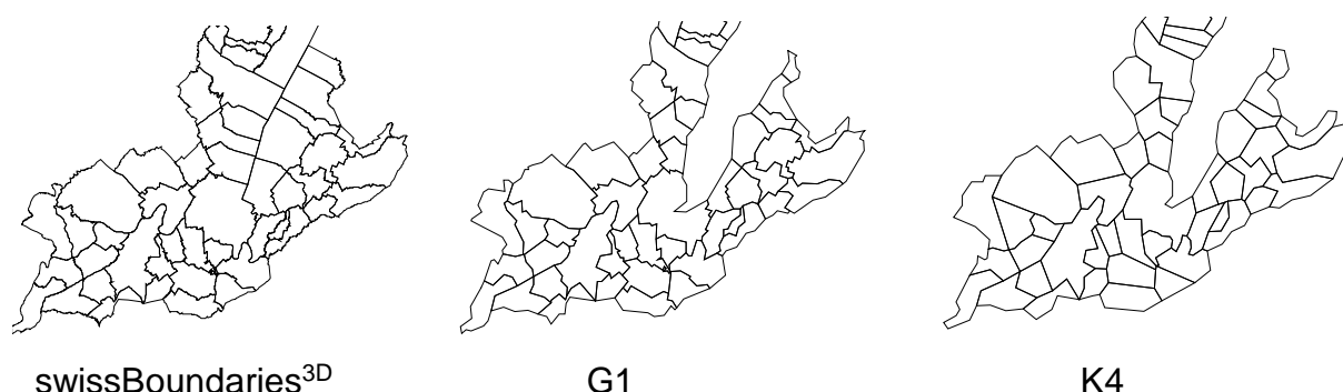
Fig. 1: Différents niveaux de généralisation

La généralisation entraîne une simplification de la géométrie et une réduction de la quantité d'information. Ceci se produit grâce à une simplification des formes des polygones et à une réduction du nombre de points sur les segments de lignes.