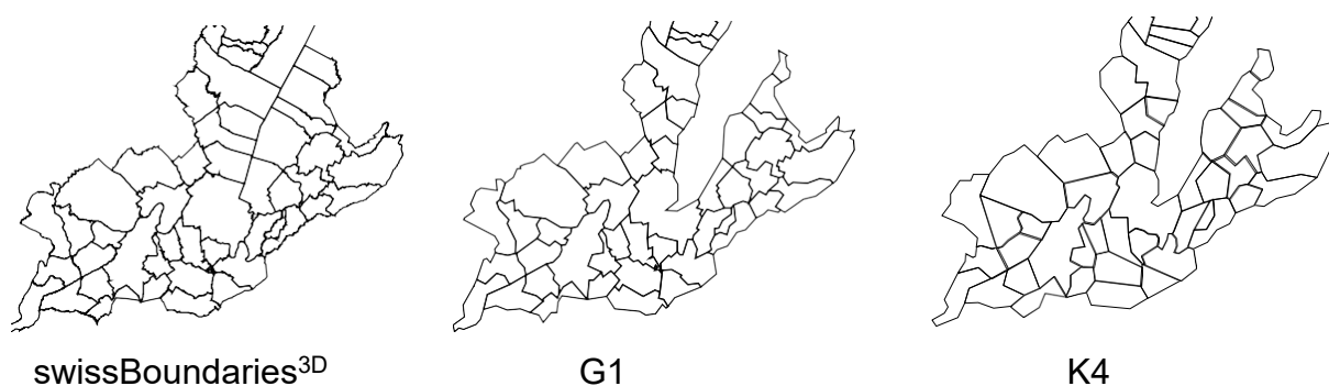
Abbildung 1: Unterschiedliche Generalisierung der Gemeindegrenzen

Die Generalisierung bewirkt eine Vereinfachung der Geometrie und eine Reduktion der Datenmenge. Dies geschieht durch die Vereinfachung der Formen der Polygone und durch die Reduzierung von Punkten in den verwendeten Liniensegmenten.