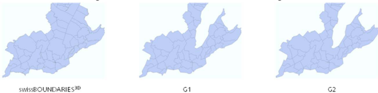
Abbildung 1: Unterschiedliche Generalisierung der Gemeindegrenzen

Die Generalisierung bewirkt eine Vereinfachung der Geometrie und eine Reduktion der Datenmenge. Dies geschieht durch die Vereinfachung der Formen der Polygone und durch die Reduzierung von Punkten in den verwendeten Liniensegmenten.