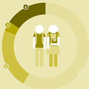
Persunas en scolaziun 2019/20, en millis