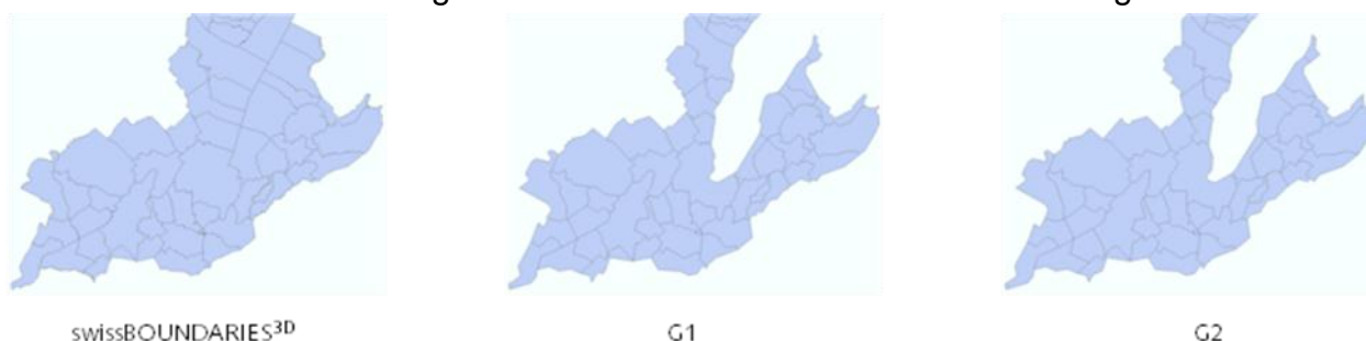
Abbildung 1: Unterschiedliche Generalisierung der Gemeindegrenzen

Die Generalisierung bewirkt eine Vereinfachung der Geometrie und eine Reduktion der Datenmenge. Dies geschieht durch die Vereinfachung der Formen der Polygone und durch die Reduzierung von Punkten in den verwendeten Liniensegmenten.