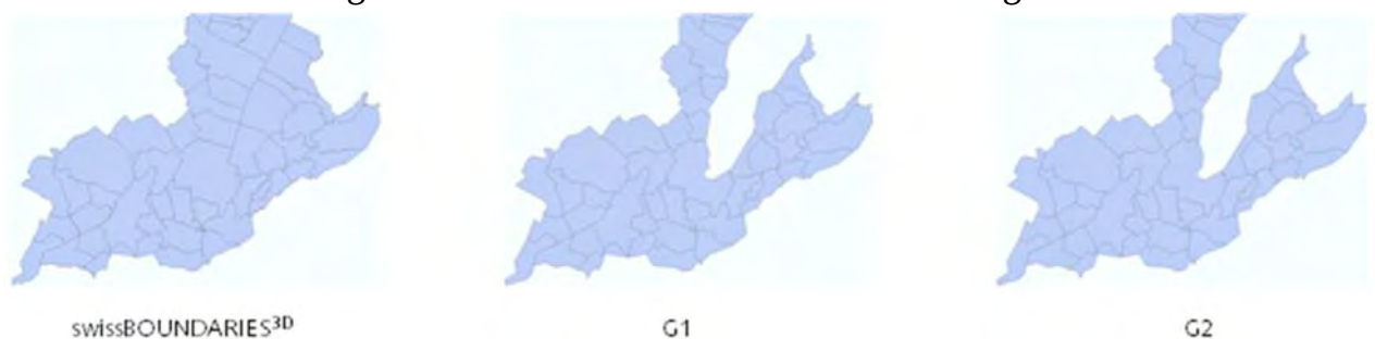
Abbildung 1: Unterschiedliche Generalisierung der Gemeindegrenzen

Die Generalisierung bewirkt eine Vereinfachung der Geometrie und eine Reduktion der Datenmenge. Dies geschieht durch die Vereinfachung der Formen der Polygone und durch die Reduzierung von Punkten in den verwendeten Liniensegmenten.